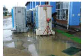
トイレの洗浄水として