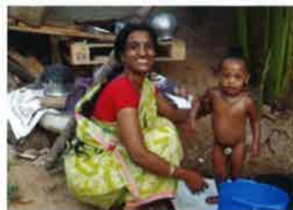
身体をふく清浄水、 洗濯水として