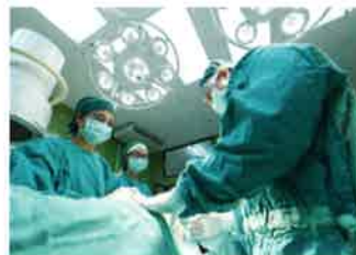
2次感染を防ぐ衛生水 として