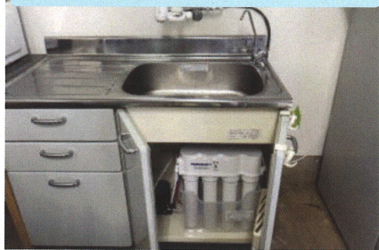
引き出しタイプキャビネット