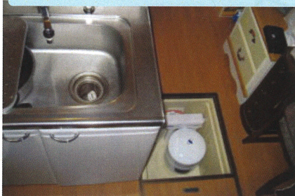
本体とタンクを床下収納に